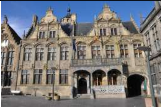
Stadhuis van Veurne