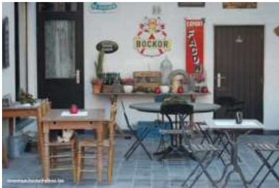
Café De Kunstemaeker – Sreenkerke